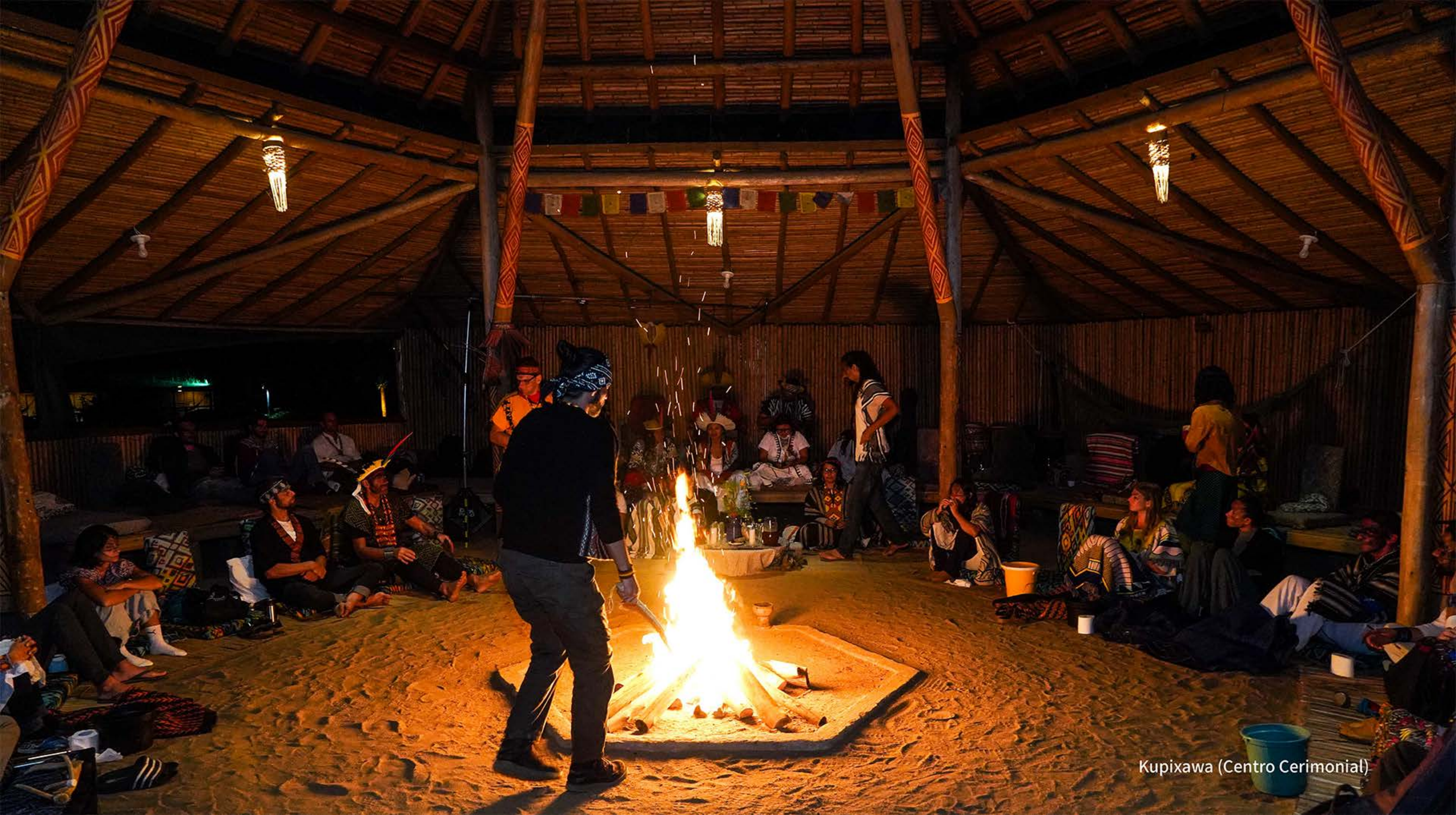
Kupixawa (Centro Cerimonial)