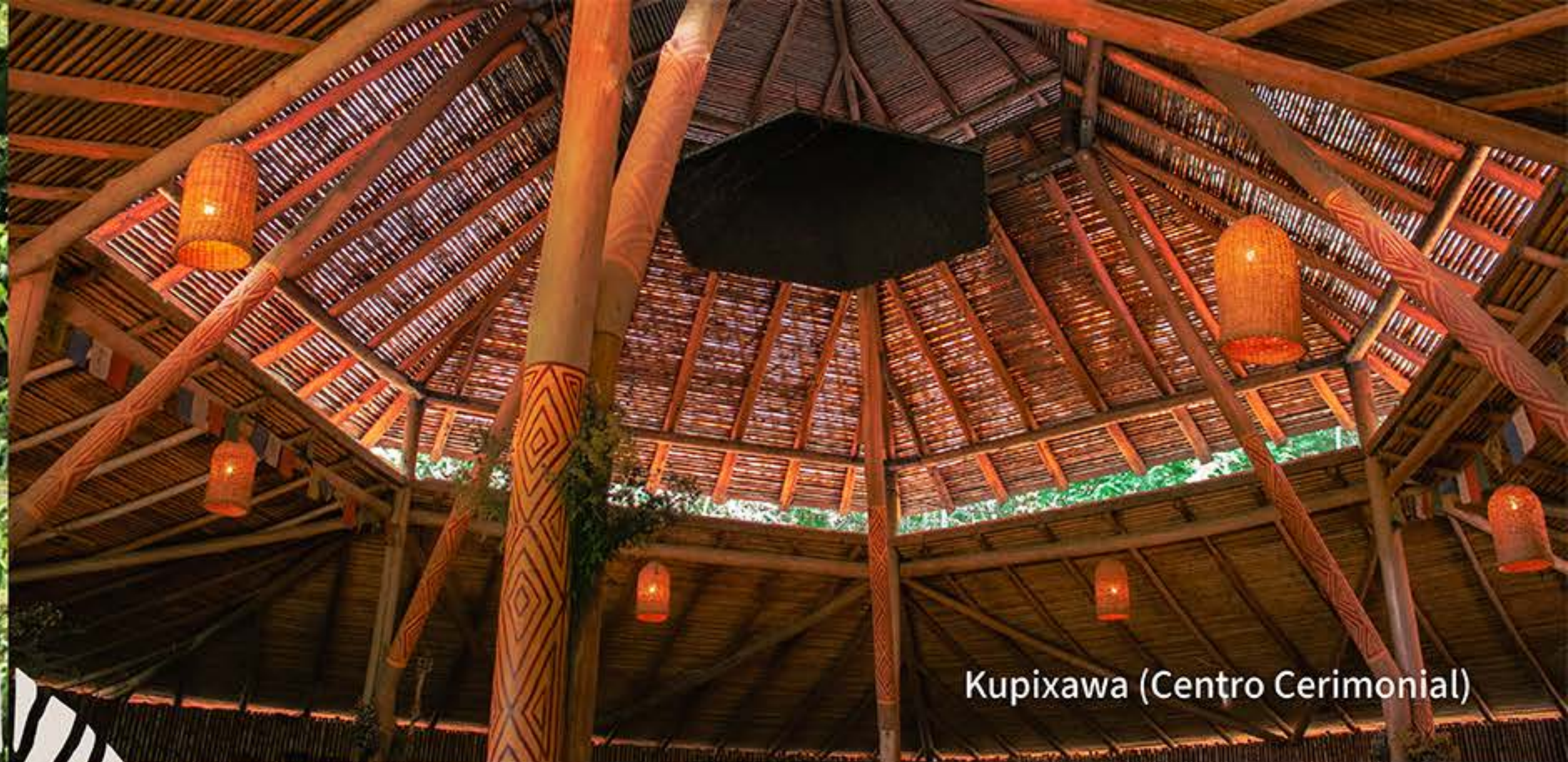
Kupixawa (Centro Cerimonial)